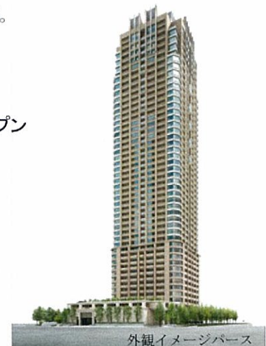
外観イメージパース