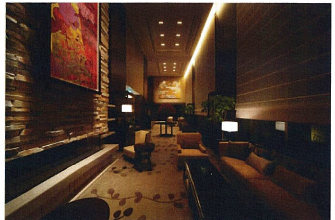
レセプションハウスでも体感できる「ザ・レセプション」(左)と「ザ・リビング」(右)